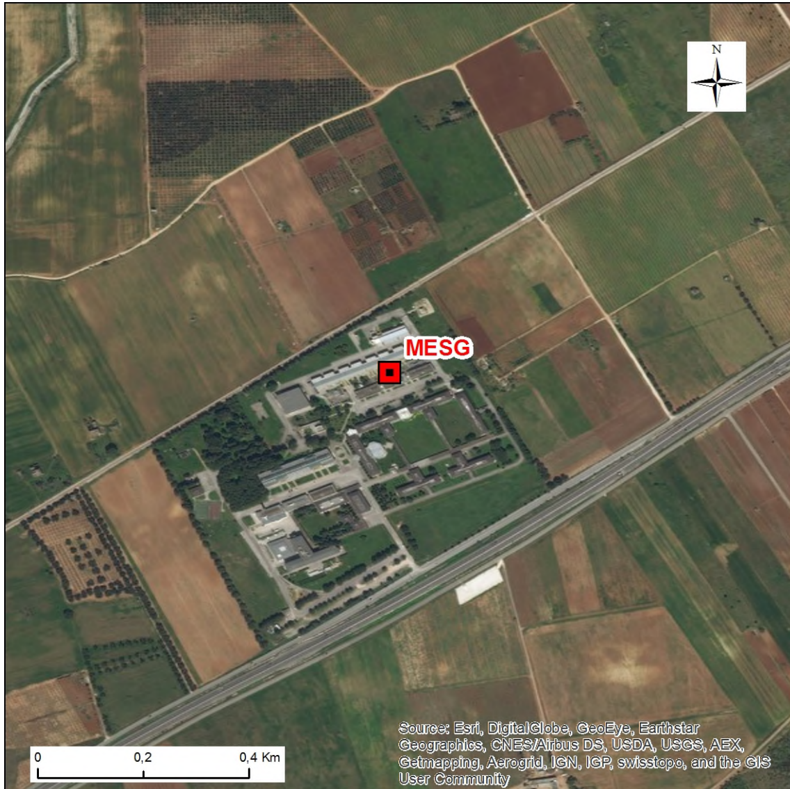
Stralcio dell'ortofoto in scala 1:10.000 con l'ubicazione della Stazione Sismica