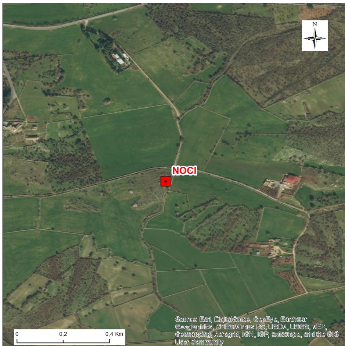
Stralcio dell'ortofoto in scala 1:10.000 con l'ubicazione della Stazione Sismica