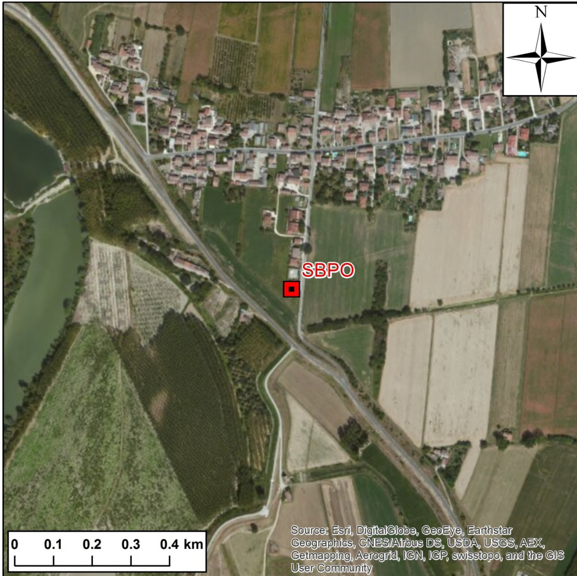
Stralcio dell'ortofoto in scala 1:10.000 con l'ubicazione della Stazione Sismica